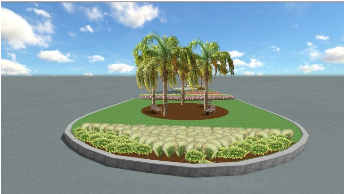
Σχέδιο ανάπλασης πλατείας(2).