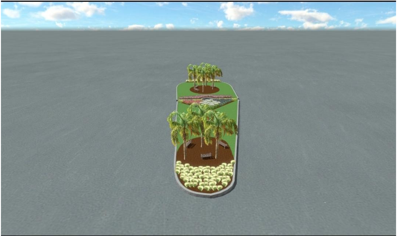
Σχέδιο ανάπλασης πλατείας (6).