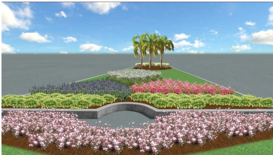
Σχέδιο ανάπλασης πλατείας(5).