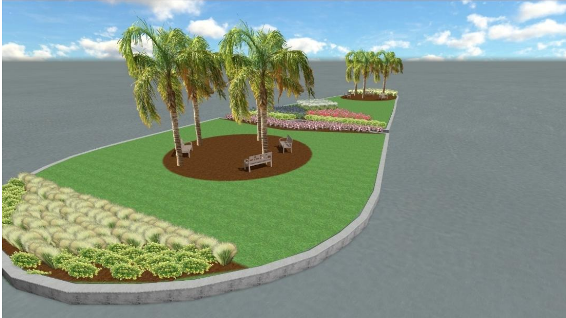
Σχέδιο ανάπλασης πλατείας(1).

Το συνολικό σχέδιο ανάπτυξης που θα προταθεί περιλαμβάνει την αισθητική και λειτουργική βελτίωση των κοινόχρηστων χώρων και την ανάδειξη των φυσικών και ειδικών αρχιτεκτονικών στοιχείων της περιοχής.