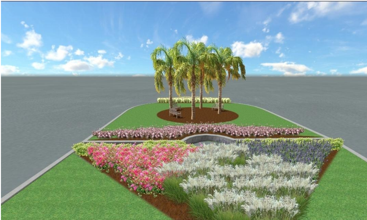
Σχέδιο ανάπλασης πλατείας(3)

➤ Γκαζόν ποικιλία rasralum 2 περίπου 700-750 τ.μ.