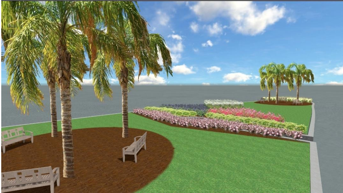
Σχέδιο ανάπλασης πλατείας(4).